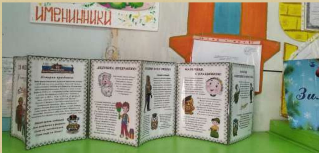
Папка передвижка «23 февраля»