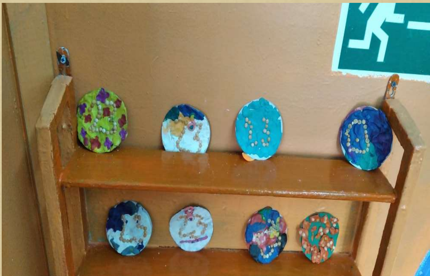
Лепка «Медаль 23 февраля»