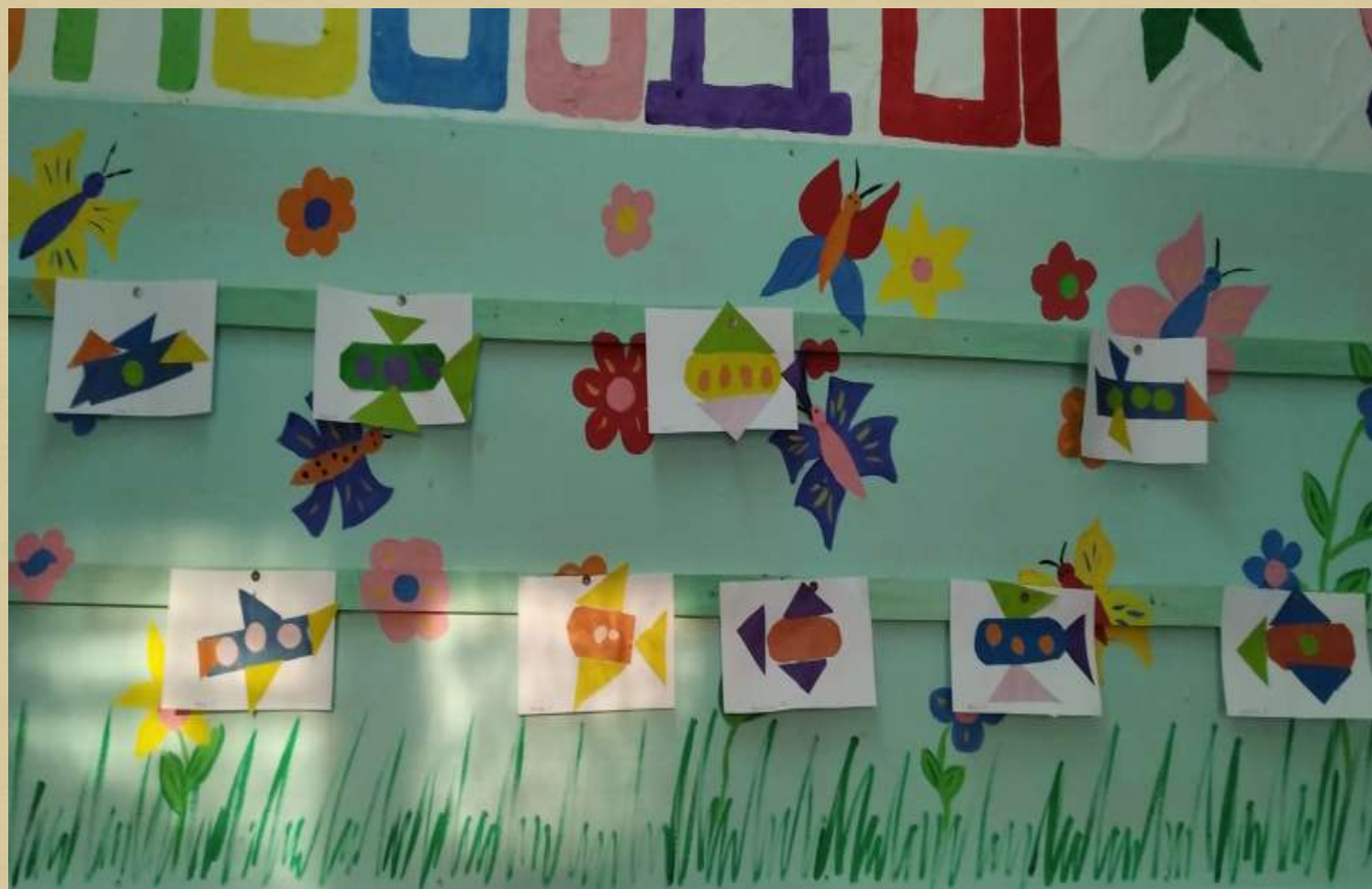
Аппликация «Петици на аэродром»