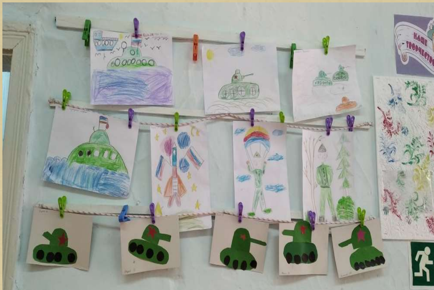
Рисование. «Военные профессии» Аппликация «Танк»