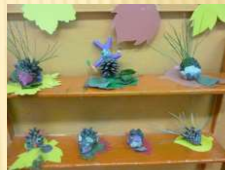
Ручной труд «Лесные жители»