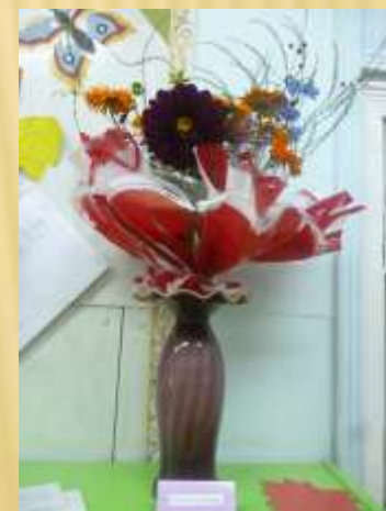
Выставка «Осенний букет»