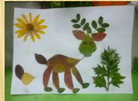
Выставка «Подделки дары осени»